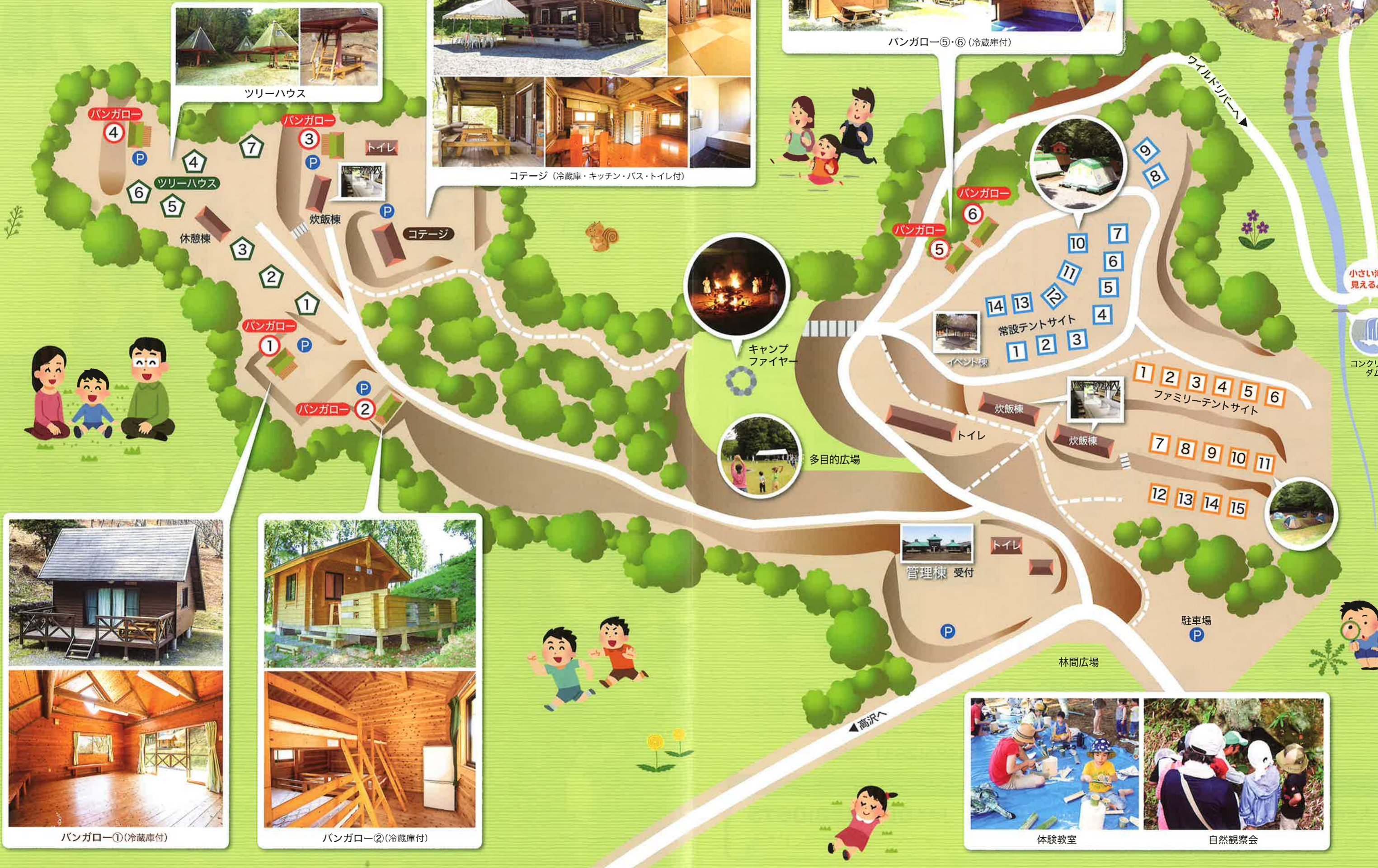
コンクリートダム