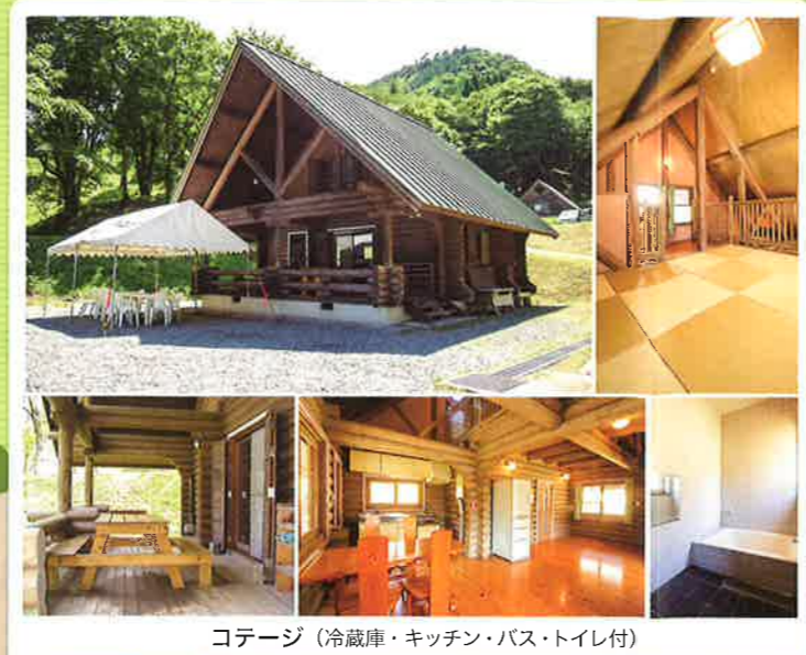
コテージ (冷蔵庫・キッチン・バス・トイレ付)