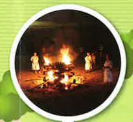
キャンプファイヤー