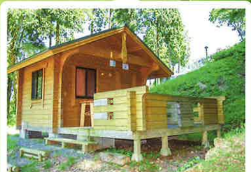
バンガロー② (冷蔵庫付)