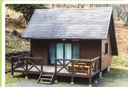
バンガロー① (冷蔵庫付)