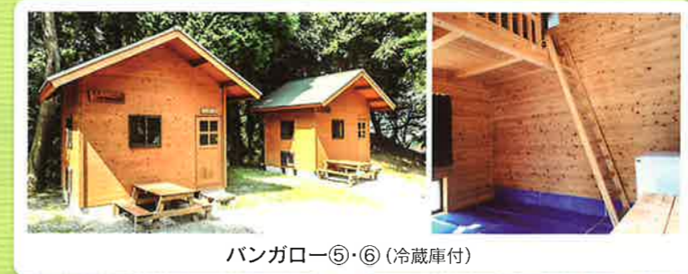
バンガロー⑤・⑥ (冷蔵庫付)