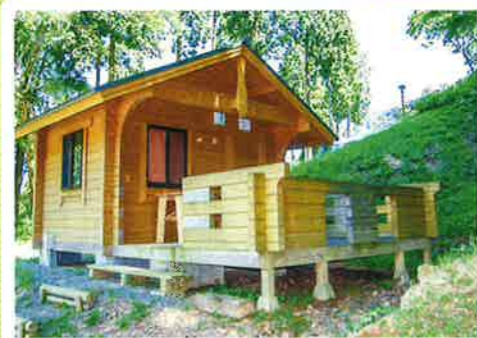
バンガロー② (冷蔵庫付)