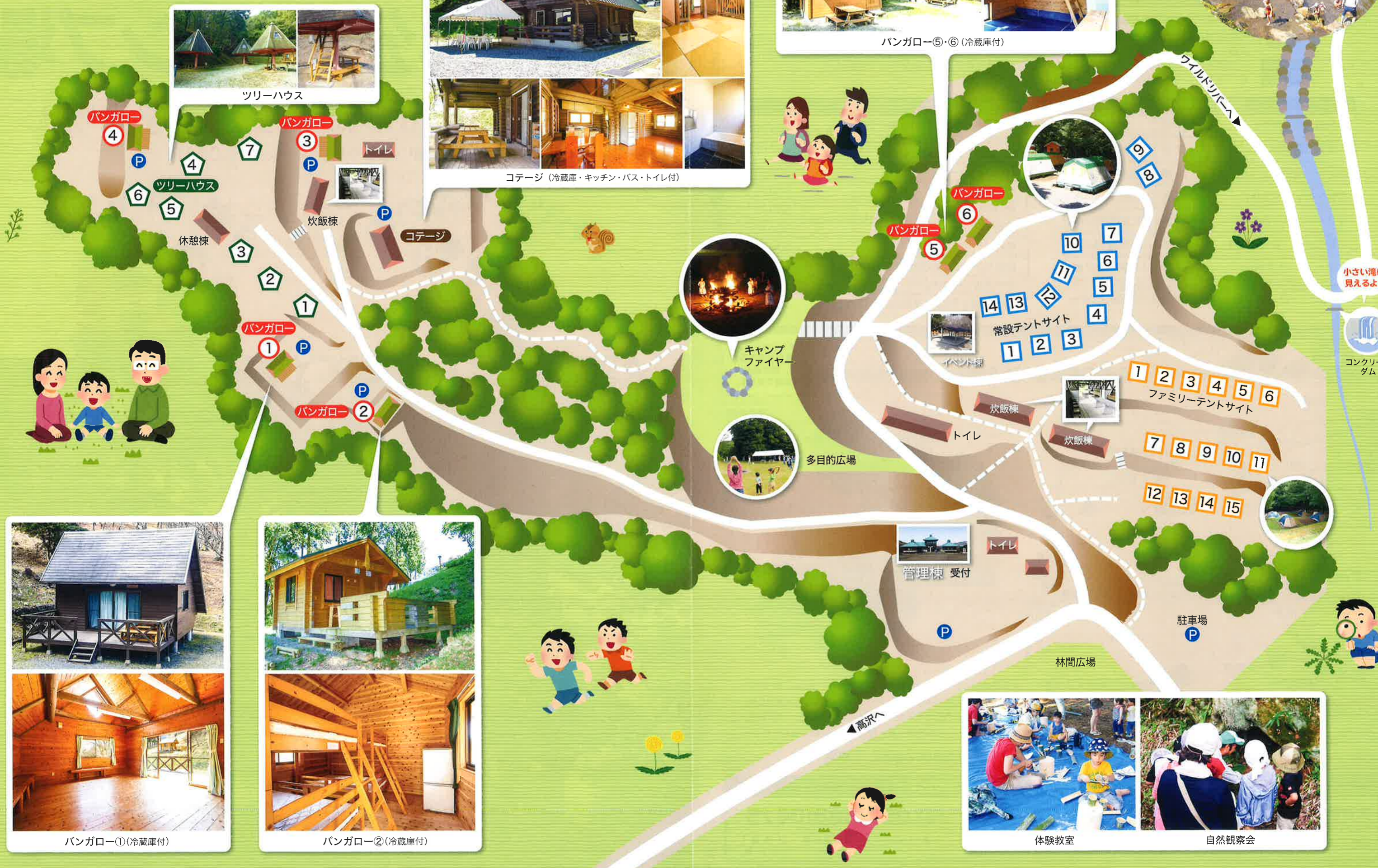
コンクリートダム