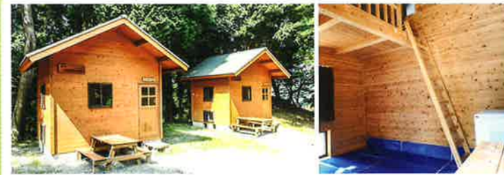
バンガロー⑤・⑥ (冷蔵庫付)