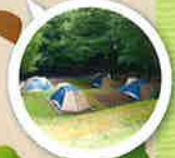
ファミリーテントサイト