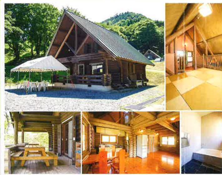
コテージ (冷蔵庫・キッチン・バス・トイレ付)