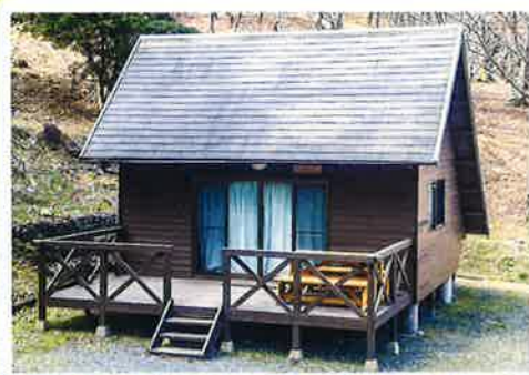
バンガロー① (冷蔵庫付)