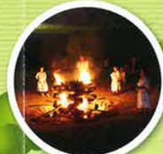
キャンプファイヤー