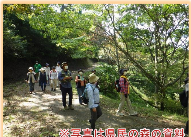
※写真は県民の森の資料